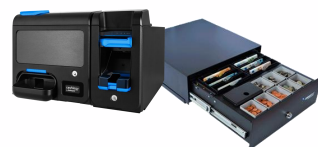
Gestão de numerário inteligente